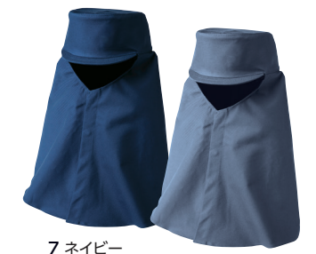
7 ネイビー 10 グレー