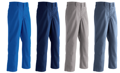
5 ブルー 7 ネイビー 8 ベージュ 10 グレー