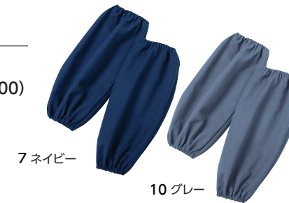
7 ネイビー 10 グレー