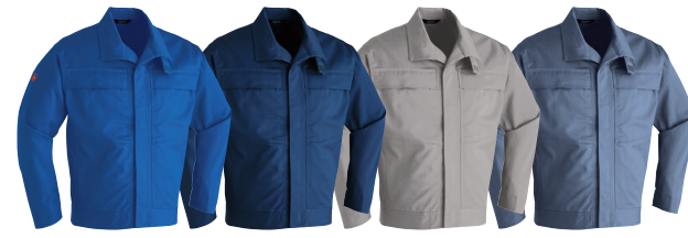
5 ブルー 7 ネイビー 8 ベージュ 10 グレー