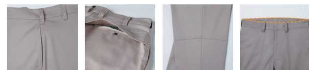
脇ポケット 高温物質 が入りにくい設計 後ろポケット (フラップ付) デザイン膝切り替え ハイバック仕様