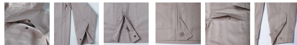
両胸ポケット (フラップ付) 袖口ボタン表裏隠し ドットボタン仕様 裾ボタン表裏隠し ドットボタン仕様 フロント 隠しボタン仕様 両胸ポケット (フラップ付) 袖口 隠しボタン仕様