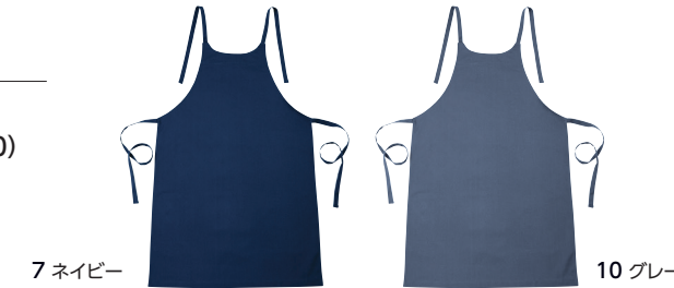
7 ネイビー 10 グレー

⚠ 天然素材のため多少の色差が生じる場合があります。洗濯により色落ちする可能性があります。また、湿った状態での着用により色移りする場合がありますので、ご注意ください。溶接時に発生する紫外線により、変色する恐れがあります。お取り扱いにご注意ください。