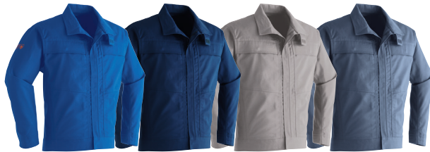
5 ブルー 7 ネイビー 8 ベージュ 10 グレー