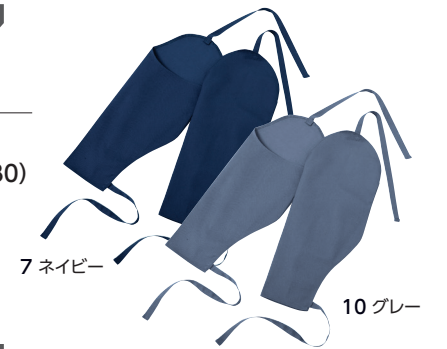
7 ネイビー 10 グレー