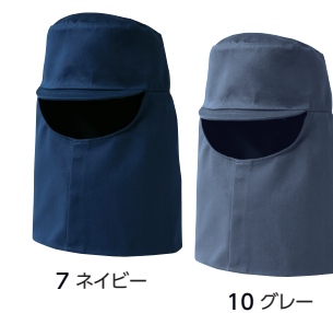
7 ネイビー 10 グレー