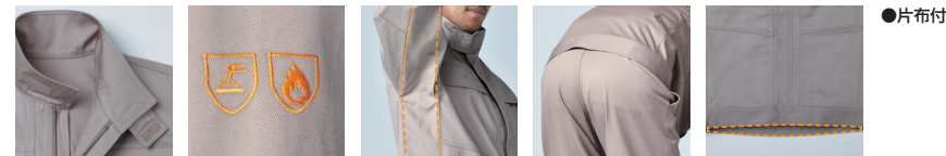
● 片布付 首元マジックテープ付 下前立て付 右袖ピクトグラム 刺繍 脇下スゴ腕革命 背中が出にくい 上下重なり設計 ドロップテイル